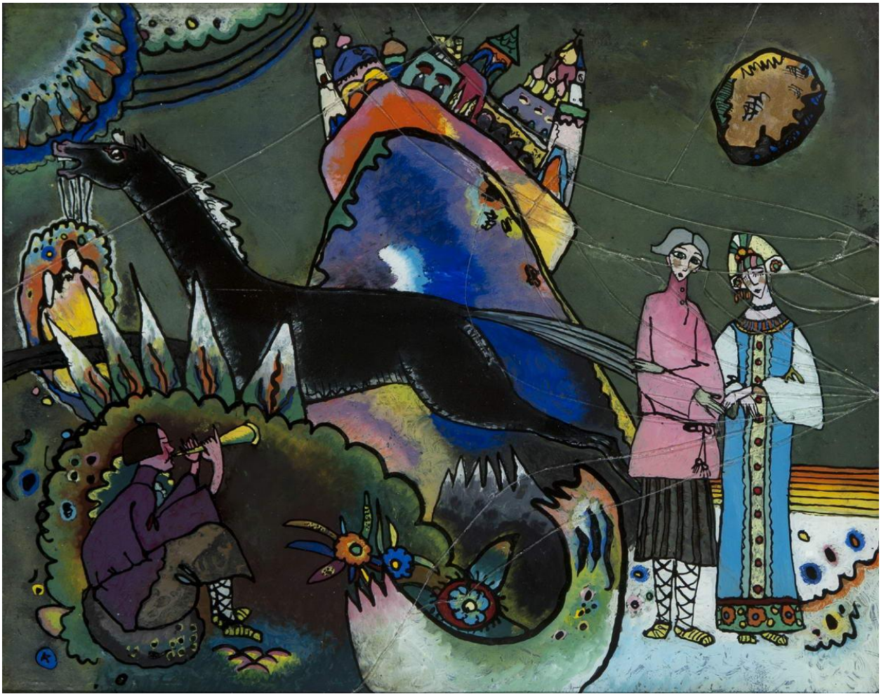
1) Василий Васильевич Кандинский. Золотое облако, 1918. Стекло, масло, 24х31. Государственный Русский музей