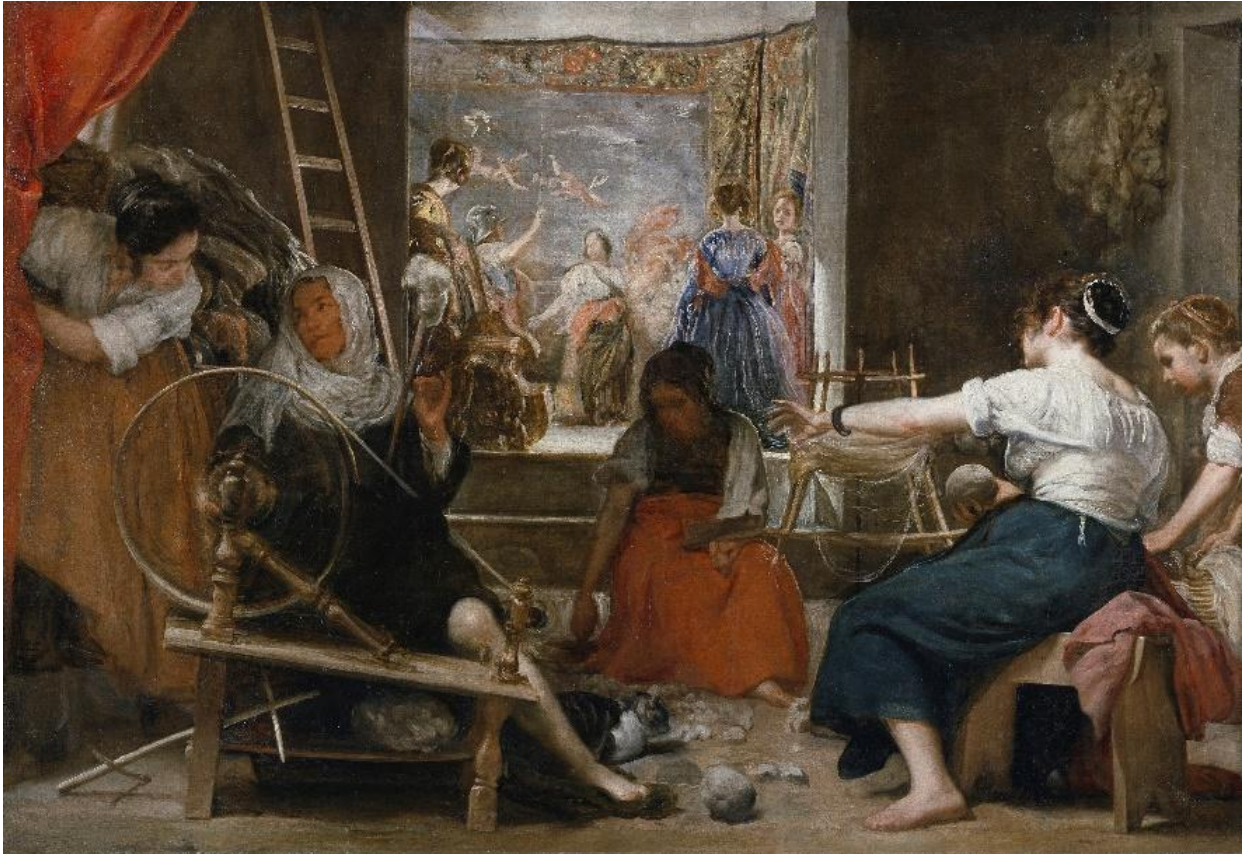
3) Диего Веласкес. Пряхи, 1655 – 1660. Холст, масло, 220×289. Прадо, Мадрид, Испания

Картина написана для дона Педро де Арсе, егеря короля Филиппа IV. Она попала в испанскую королевскую коллекцию в XVIII веке и, вероятно, была повреждена во время пожара в Королевском Алькасаре в Мадриде в 1734 году. Картина была надставлена по бокам (всего 37 см) и сверху (ок. 50 см) и ныне выставлена с рамой, закрывающей отрезанную часть и демонстрирующей только первоначальные размеры – как и на репродукции выше. На заднем плане изображен гобелен, отсылающий к картине Тициана «Похищение Европы» (1500-1562), знакомой Веласкесу по реплике кисти П.П. Рубенса (1628), с которым именно в это время около года он делил мастерскую при испанском дворе в Мадриде.